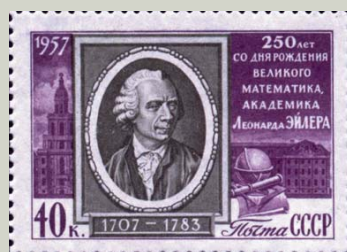
Leonard Euler (1707 -1783)

mu y curioso que en 1867 un joven italiano de 16 años, desconocido científicamente, NICOLÁS PAGANINI encontró que 1.184 y 1.210 eran amigos... los siguientes a 220 y 284 y se les pasó a todos los matemáticos.