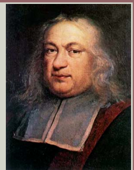
Pierre Fermat (1601 -1665)

encontró a la pareja amistosa 9.363.584 y 9.437.056. El gran Euler tuvo un gaza-po en sus cálculos cuando construyó una tabla con 64 parejas de amigos, de los que más tarde se demostraría que una pareja era de falsos amigos. Resulta